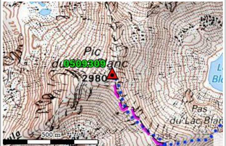
Carte : 3535 NEVACHE

De NEVACHE, se rendre aux Chalets de FONTCOUVERTE, puis à ceux de RICOU en véhicule tous terrains. Emprunter ensuite un chemin qui se dirige vers le Lac LARAMON, le quitter en A, remonter vers le Nord et suivre ainsi le ravin de LA RECARE. Gagner l'arête de La CULA et rejoindre le sommet où se trouve le point. (2H30 de marche depuis Les Chalets de RICOU).