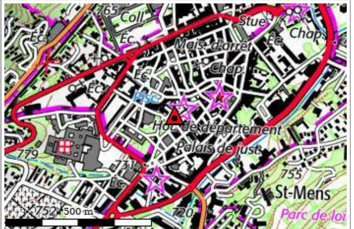
Carte : 3338 GAP