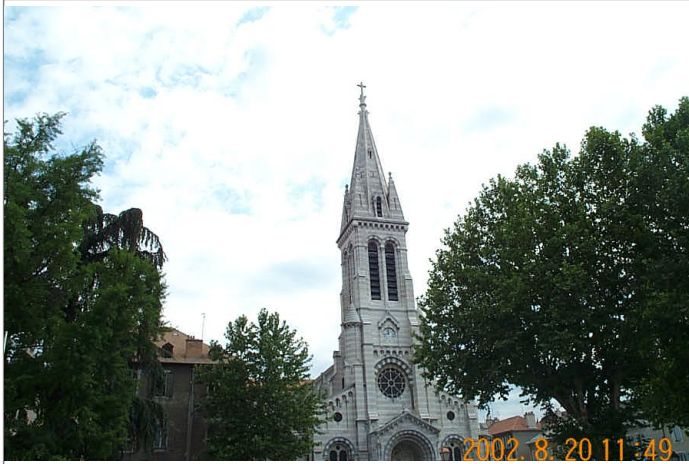
Azimut de la prise de vue : 95 gr