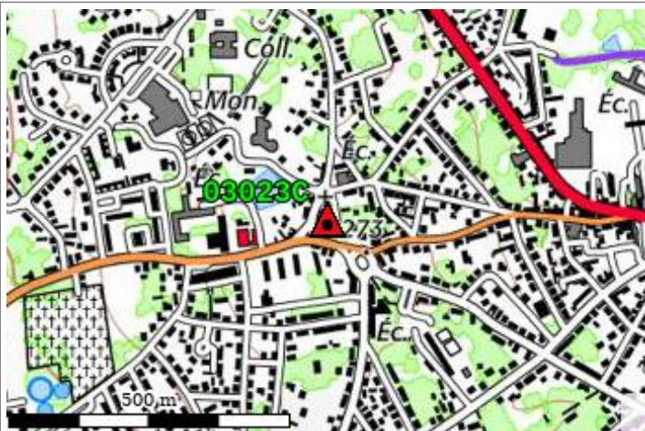
Carte : 2629 VICHY