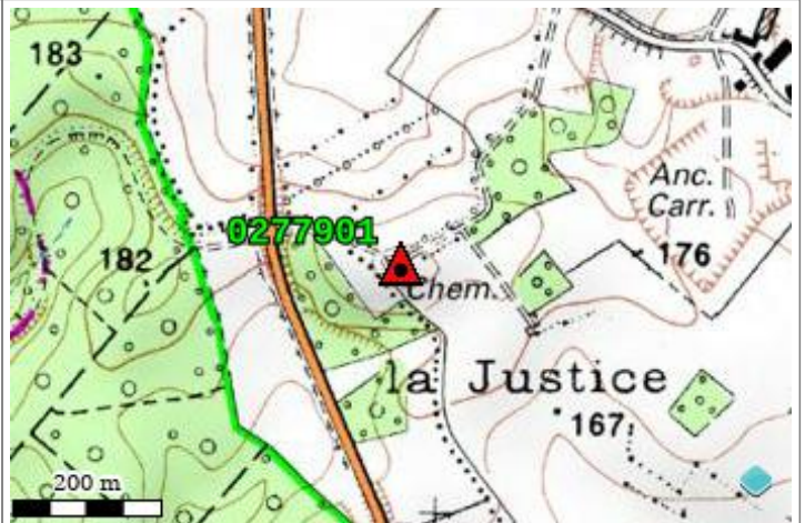
Carte : 2708 GUISE