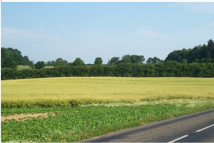
Azimut de la prise de vue : 165 gr