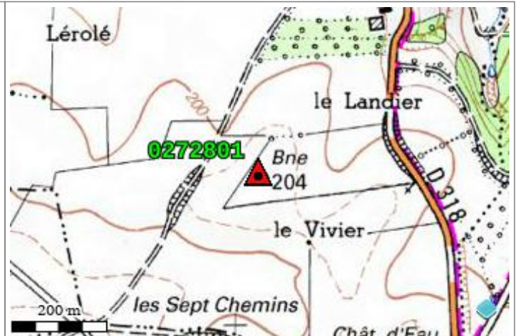
Carte : 2708 GUISE