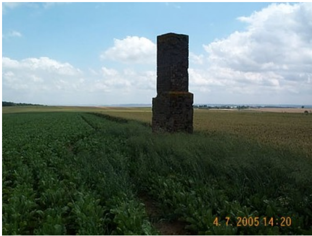
Azimut de la prise de vue : 146 gr