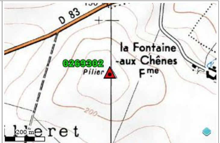
Carte : 2612 FERRE-EN-TARDENOIS