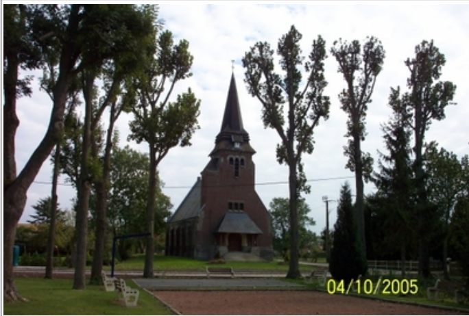
Azimut de la prise de vue : 121 gr