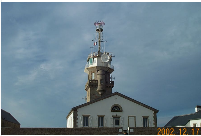
Azimut de la prise de vue : 320 gr

No du Site 2916801 Site du Réseau de détail