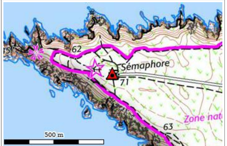
Carte : 0319 POINTE DU RAZ