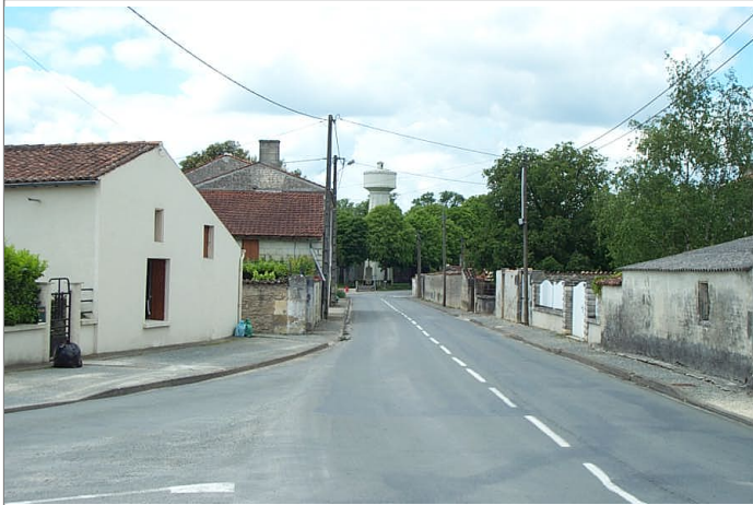
Azimut de la prise de vue : 300 gr