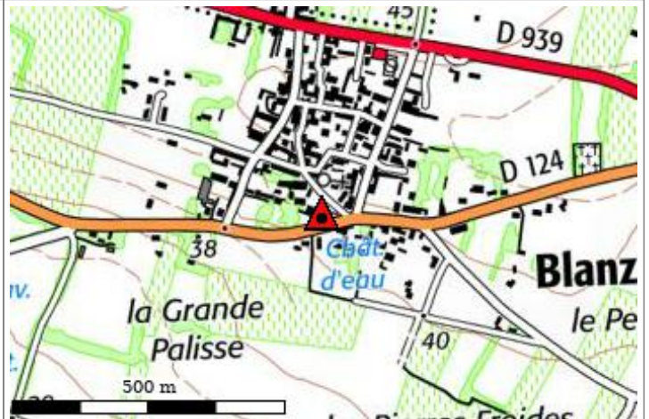
Carte : 1631 MATHA