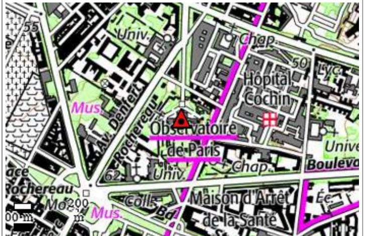
Carte : 2314 PARIS