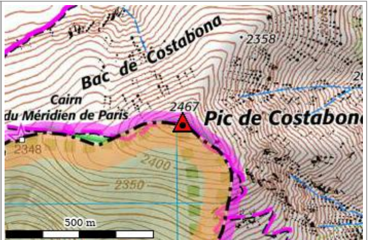
Carte : 2350 PRATS-DE-MOLLO-LA-PRESTE